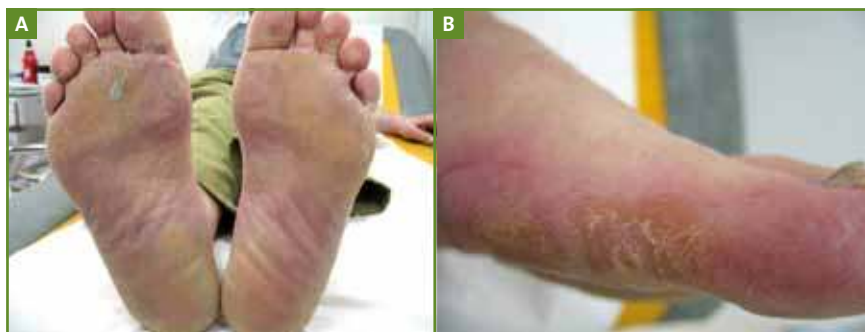
FIG. 4A ET 4B : Erythrodysesthésie (syndrome main/pied) kératosique lié au sorafenib. (Collection département de Dermatologie, CHRU, Montpellier).

Le sorafenib est un inhibiteur multivalent de tyrosine kinase interagissant avec les récepteurs de type 2 et 3 au VEGF, mais également au PDGF, c-kit et avec les molécules FLT3 Raf-1 et BRAF intracellulaires. Les indications sont surtout représentées par des tumeurs rénales avancées ou les hépatocarcinomes, mais d'autres cibles sont actuellement en cours d'investigation. Des effets indésirables cutanés apparaissent essentiellement au cours des 6 premières semaines et sont souvent de grade modéré (1 ou 2). Les plus fréquents sont un type particulier de syndrome main/pied ou érythrodysesthésie, un érythème facial de type dermite séborrhéique, des exanthèmes maculopapuleux, des alopecies diffuses ou en plaques temporaires et des hémor-