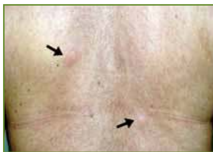
FIG. 6 : Eruption érythémateuse papulo-nodulaire du tronc (bortezomib).

Mek. Des modifications de naevus (involution, modifications de taille et/ou de couleur, apparitions de critères d'atypie, efflorescence de nouveaux naevus) ainsi que l'apparition paradoxale de mélanome sous traitement ont également été signalées. Ces effets indésirables nécessitent un monitoring cutané très précis mais ne semblent pas particulièrement liés à l'efficacité du traitement. Le développement d'autres anti-BRAF (dabrafenib), d'agents anti-Mek, anti-Erk et anti-Ras est en cours, mais leur profil d'effets indésirables cutanés n'est pas encore connu avec précision.