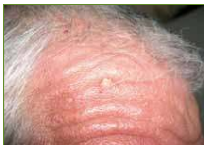
FIG. 5 : Carcinomes épidermoïdes cutanés liés au vemurafenib. (Collection département de Dermatologie, CHRU, Montpellier).