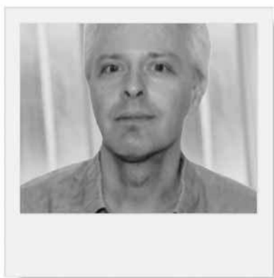
→ O. DEREURE Service de Dermatologie, CHU, MONTPELLIER.

Ces effets indésirables sont polymorphes et portent notamment sur les follicules pileux, les phanères et plus généralement sur la différenciation des kératinocytes avec parfois apparition paradoxale de tumeurs cutanées épithéliales. Ils peuvent entraîner une détérioration importante de la qualité de vie, notamment en ce qui concerne les agents anti-récepteurs de l’EGF très utilisés actuellement. Dans certains cas, leur apparition et leur intensité sont corrélées à la réponse tumorale.