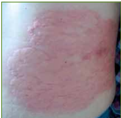
FIG. 2: Eruption urticarienne après une première perfusion de rituximab pouvant révéler des localisations cutanées infracliniques du lymphome B cutané traité.

cliniquement occulte ( fig. 2 ) [1]. Cette réaction urticarienne, parfois assez impressionnante mais sans véritable gravité, apparaît très généralement à la première perfusion au cours des trente premières minutes et, en principe, ne récidive pas lors des perfusions ultérieures. Elle est assez facilement prévenue par l'utilisation systématique d'une prémédication par corticoïdes et antihistaminiques, mais également par un débit initial volontairement ralenti. En cas d'apparition d'une réaction urticarienne forte, la perfusion doit être interrompue et éventuellement reprise le lendemain, mais la réaction survient parfois de façon retardée, une à deux heures après la fin de la perfusion. Il faut rechercher à titre systématique des signes de gravité (hypotension, signes pulmonaires, défaillance vasculaire périphérique) qui sont en fait rares. D'autres manifestations cutanées ont été rapportées avec le rituximab, notamment vasculite leucocytoclasique, maladie sérique avec réaction urticarienne, dermatose lichénoïde ou vésiculo-bulleuse, voire nécrose épithéliale toxique. L'alemtuzimab peut également être générateur de réactions d'hypersensibilité authentiques ou de libération cytokinique avec lésions urticariennes, mais également de vasculite