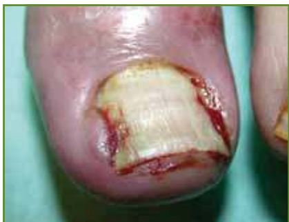
FIG. 9: Anti-EGFR: paronychie inflammatoire (Collection département de Dermatologie, CHRU, Montpellier).

régression complète des kératoses actiniques existantes. Les paronychies sont fréquentes et atteignent préférentiellement les pouces et les hallux, localisés sur les replis latéraux des doigts et des orteils et pouvant prendre un aspect de pseudo-granulome pyogénique ou d'ongle incarné ( fig. 9 ); elles surviennent 2 à 4 mois après le début du traitement et peuvent atteindre tous les ongles. Elles se compliquent fréquemment de surinfections bactériennes à staphylocoques dorés ou fongiques à Candida albicans .