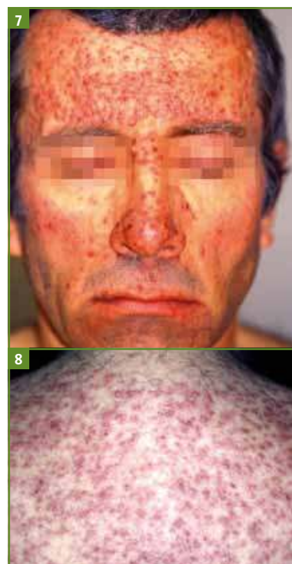
FIG. 7 ET 8 : Eruptions papulo-pustuleuses folliculaires "acnéiforme" du visage et du tronc liée aux anti-EGFR. (Collection département de Dermatologie, CHRU, Montpellier).

Les premiers effets indésirables cutanés rapportés (et qui restent les plus fréquents) sont incontestablement les lésions papulo-pustuleuses "acnéiformes" [3, 4, 15]. Ces lésions apparaissent rapidement, souvent 1 à 2 semaines après la mise en place du traitement, et leur incidence dépend du type de molécule et de la posologie car elles sont souvent dose-dépendantes. Elles sont particulièrement fréquentes avec le cetuximab (jusqu'à 90 % des cas), mais moins fréquentes avec le panitumumab, le lapatinib et l'erlotinib. Les lésions se présentent sous la forme d'éléments papuleux ou papulo-pustuleux, parfois télangiectasiques, voire hémorragiques et/ou croûteux, atteignant essentiellement le visage, notamment dans sa région centrale et en particulier les zones séborrhéiques mais peuvent également s'étendre au cou, voire au tronc et aux membres supérieurs ( fig. 7, 8 ). Les paumes et les plantes sont habituellement respectées. Les lésions sont souvent prurigineuses, voire douloureuses. Les