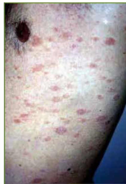
FIG. 3: Eruption cutanée pityriasis rosé de Gibert-like liée à l'imatinib mesylate.

L' imatinib mesylate est historiquement le premier inhibiteur de tyrosine kinase utilisé en clinique humaine, inhibiteur des récepteurs c-kit et au PDGF mais également de BCR-ABL et utilisé dans la leucémie myéloïde chronique, les tumeurs stromales gastro-intestinales et les mastocytoses systémiques essentiellement. Le principal effet indésirable est un rash cutané assez particulier, apparaissant souvent tardivement (8 semaines en moyenne), maculopapuleux, parfois vaguement psoriasiforme, voire ressemblant à un pityriasis rosé de Gibert, atteignant essentiellement le visage, les membres supérieurs et le tronc ( fig. 3 ) [3, 4]. Dans de rares cas, une érythrodermie peut apparaître si le traitement est poursuivi. L'éruption est clairement dose-dépendante, apparaît en général au-delà de 400 mg/j et répond